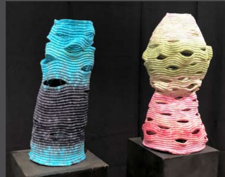
Wasser und Luft

Les œuvres actuelles d'Anna Busch sont des objets textiles. Des peintures aux fonds mythiques, des sculptures et des objets en bois, en pierre et en papier mâché sont également présentés.