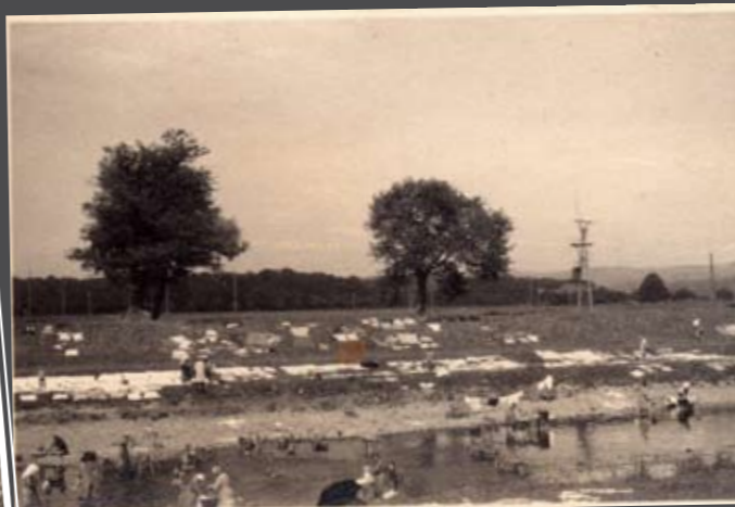
Endinger Wäschwieber an der Elz 1928, Foto: Seckinger

Les lieux favoris de rencontre et d'échanges d'autrefois étaient les berges de l'Elz et du canal Léopold.